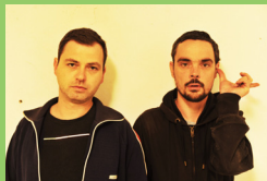
Dead Fish Audio | I Love Your Soul Honey

Sie gehen auf große Reisen, kehren jedoch immer wieder gern zurück. Die drei Jungs von Elster Club, die mittlerweile bei VelocitySounds unter Vertrag stehen, sind bei tetmusik groß geworden und beweisen mit ihrem Beitrag einmal mehr ihre anhaltende Frische.