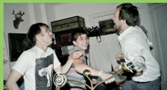
Elster Club | Simple Life