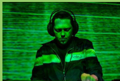
the_empath | Idiosyncratic

Orange Dot kann sich nicht entscheiden und kommt dann doch auf den Punkt. Der *FREQUENZCAMPING-Gründer bastelt an verschachtelten Rhythmen für komplexe Clubmusik, bleibt konsequent verrauscht, wildert mit Vorliebe im Elektrodröckicht und versinkt in wilder Harmonie zwischen Tiefbass und Hallfahnen.